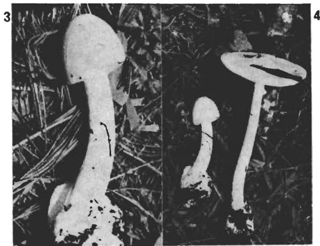
Figs. 1-4. Amanita virosa . 1: Corte longitudinal de una lámina mostrando los basidios, basidiolos y la trama. 2: Esporas. 3: Esporóforo joven. 4: Esporóforos joven y adulto (Dibs. y Fotos de Pérez-Silva).

cos da instantáneamente una coloración amarilla; en el estípite ocasionalmente se presenta la misma reacción; dichas reacciones de coloración se manifiestan incluso en material de herbario de más de 15 años según se comprobó en ENCB.