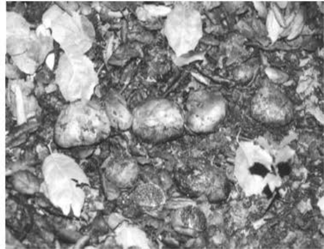
Figura 2: Melanogaster umbrinogleba BCMEX 8532

Esta especie se caracteriza por presentar cuerpos fructíferos de superficie de color marrón oscuro con ligeros tonos vináceos, lisa con venaciones o rizoides hacia la base. Gleba algo gelatinosa cuando fresca con venaciones,