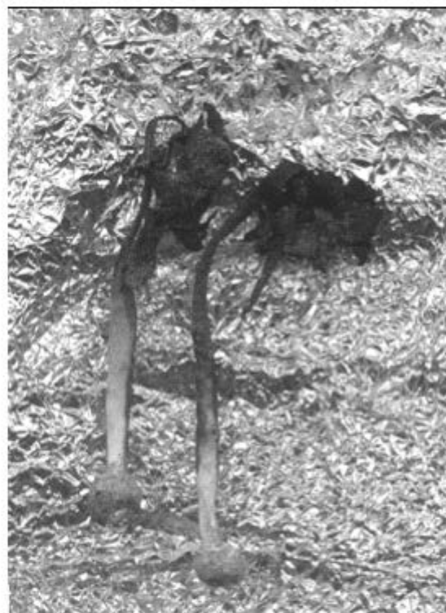
Figura 1: Coprinus xerophilus BCMEX 8502

Cuerpo fructífero de 8 – 20 cm de largo, sombrero cilíndrico, delcuescente de abajo hacia arriba, con la superficie blanquecina, escamosa, carnoso. Láminas abundantes, libres a casi libres, delicadas. Estipite de 5 – 16 cm de largo por 1 – 2 cm de ancho, hueco a sólido. Base bulbosa similar a una volva, algunas veces presenta unos rizoides gruesos, de color blanquecino-pardo. Esporas de 17–20 x 11.5 – 13µm, lisas, elipsoidales, de color marrón a